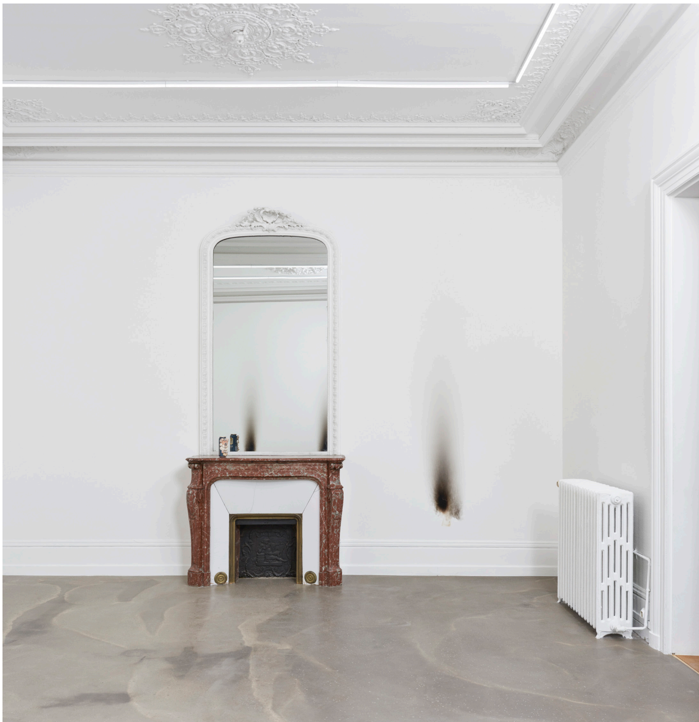
Olivier Kosta-Théfaine Un rideau fleuri Cache la pluie, le vent Vue d'exposition (détail)