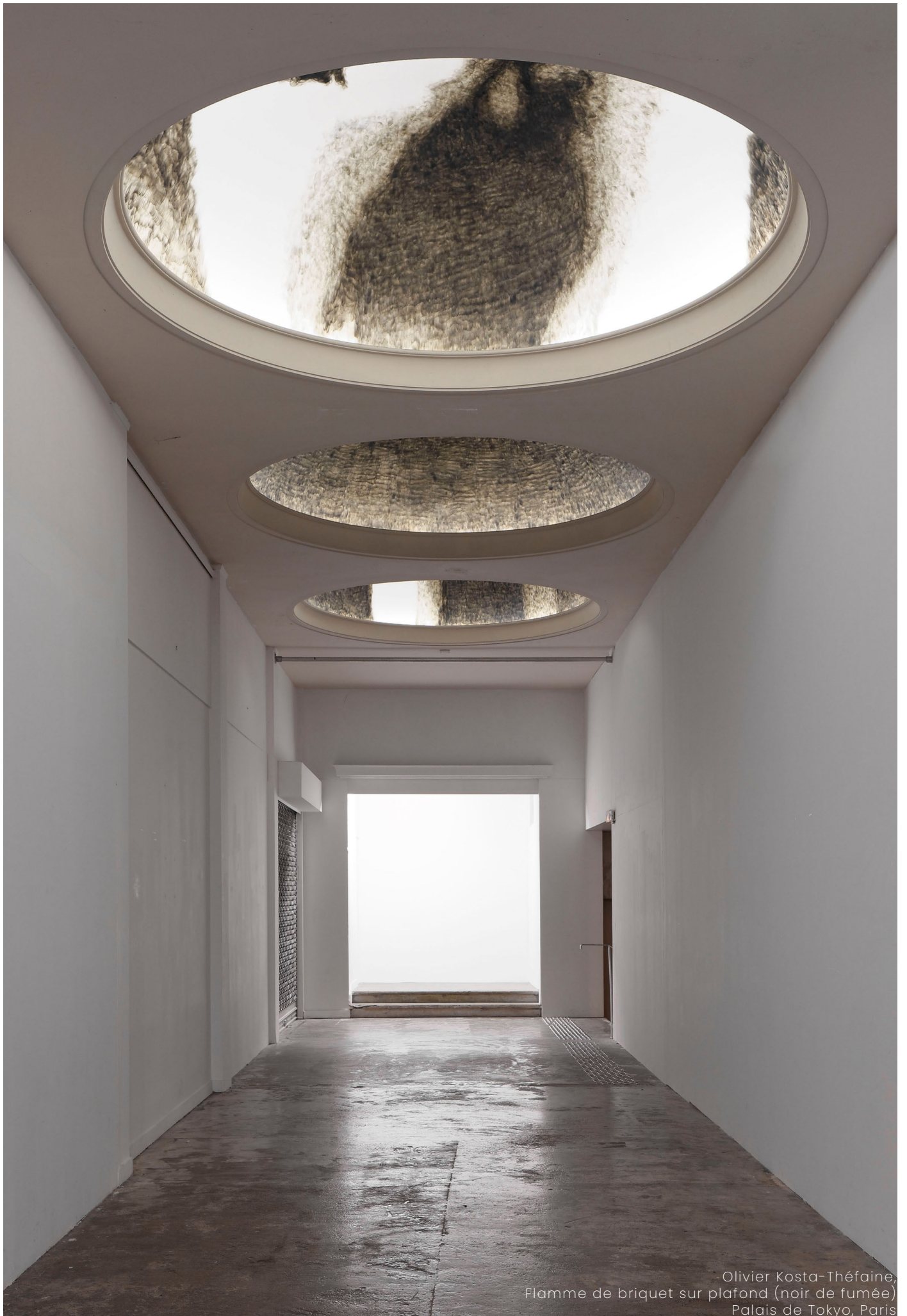
Olivier Kosta-Théfaine, Flamme de briquet sur plafond (noir de fumée) Palais de Tokyo, Paris