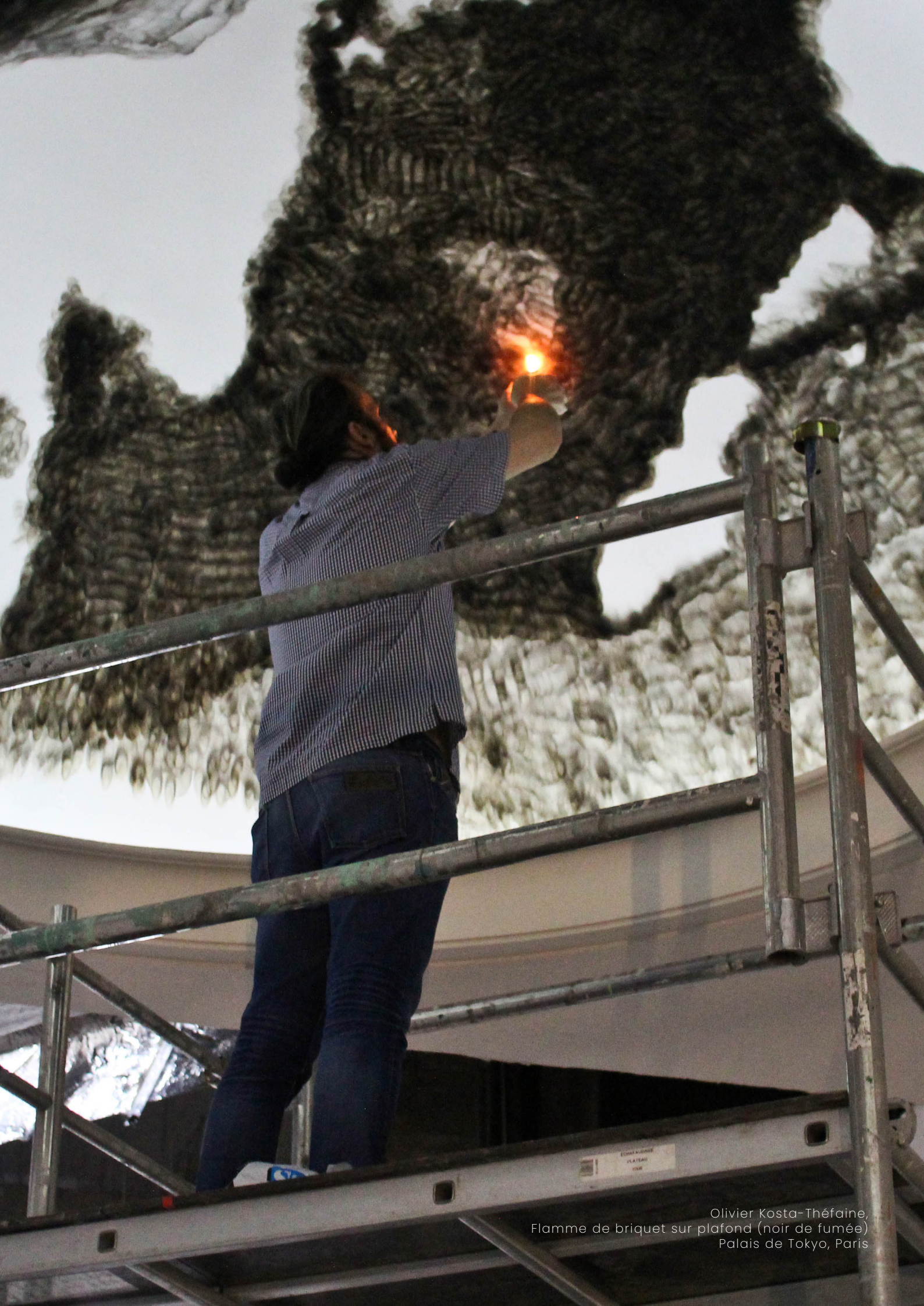
Olivier Kosta-Théfaine, Flamme de briquet sur plafond (noir de fumée) Palais de Tokyo, Paris