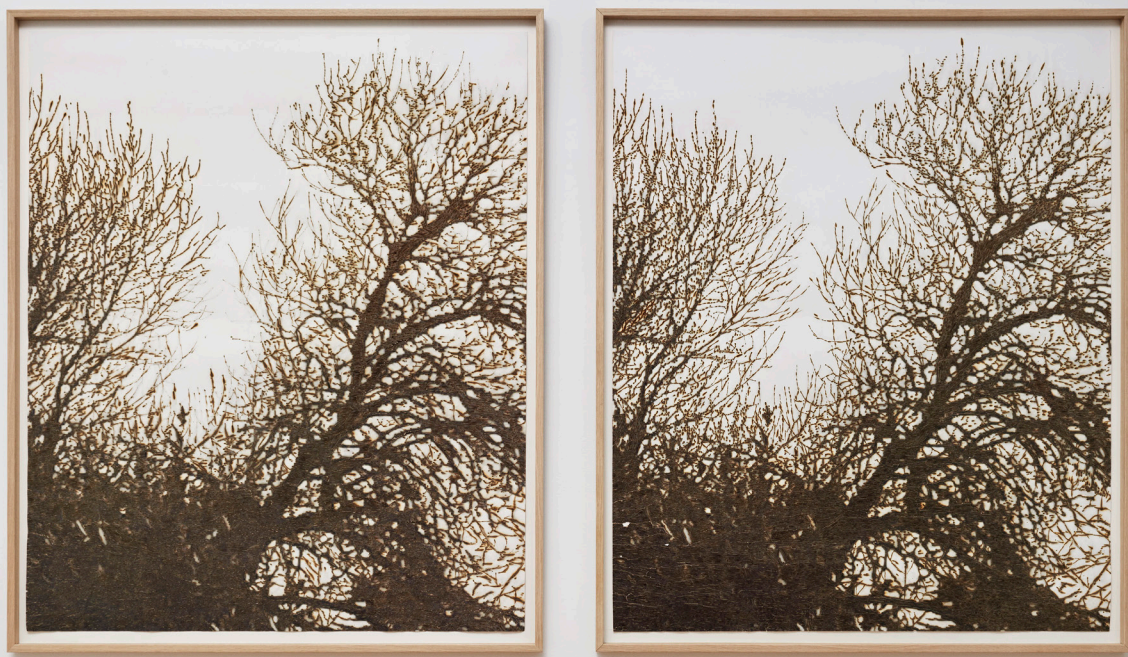
Olivier Kosta-Théfaine Un rideau fleuri Cache la pluie, le vent Vue d'exposition (détail)