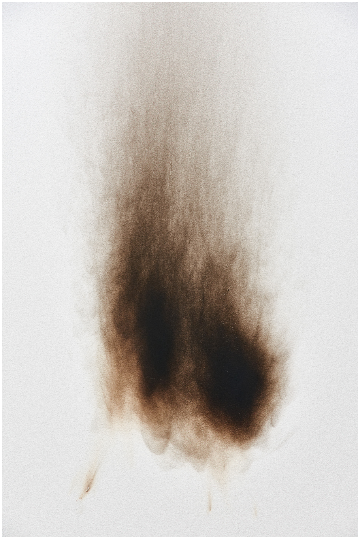
Olivier Kosta-Théfaine Sans titre (un lundi 6), 2025 Dimensions variables Noir de fumée