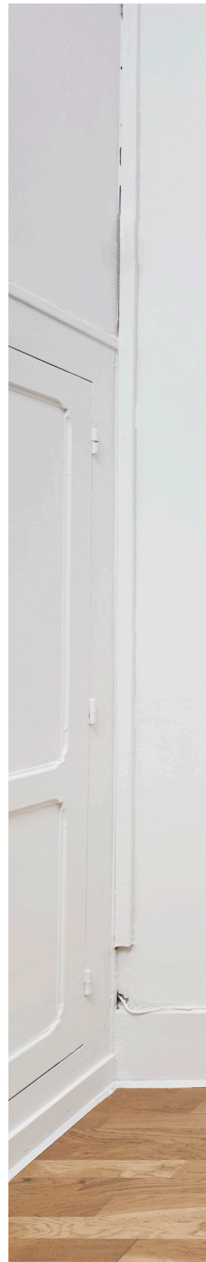
Olivier Kosta-Théfaine Un rideau fleuri Cache la pluie, le vent Vue d'exposition (détail)