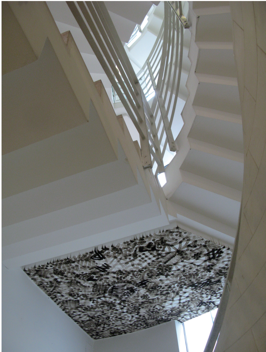
Olivier Kosta-Théfaine Flamme de briquet sur plafond (noir de fumée) Vue d'exposition (détail) Fondation Cartier, Paris