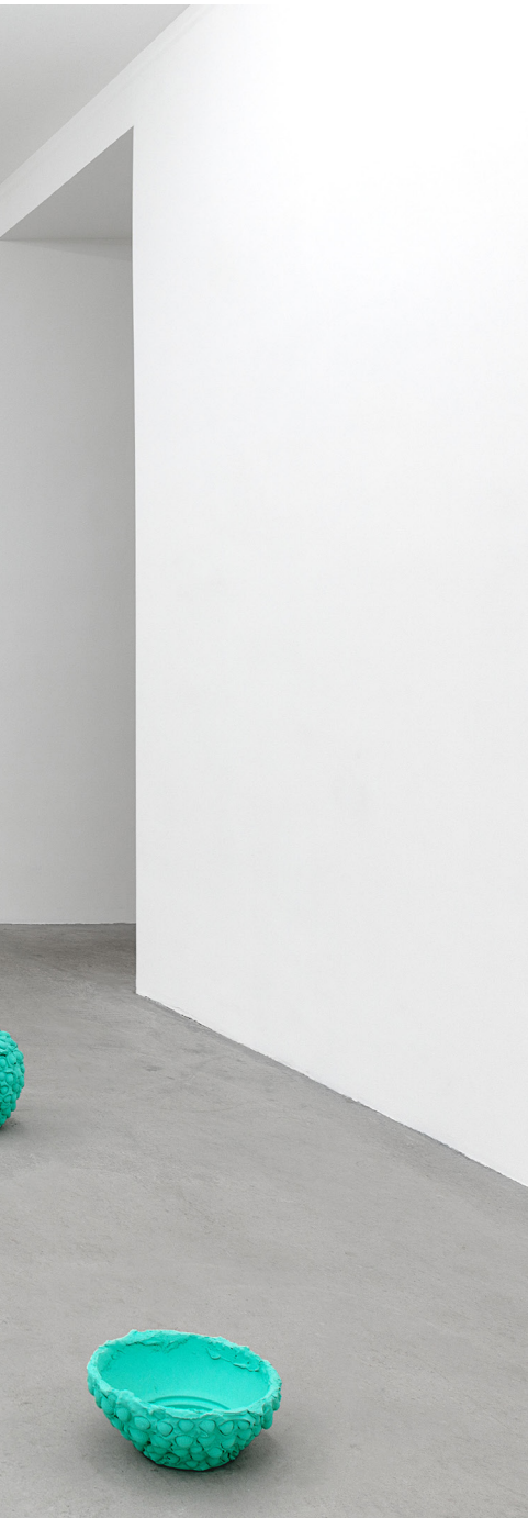
Olivier Kosta-Théfaine Aria di Roma, 2018 Vue d'exposition (détail) Rabouan Moussion, Paris